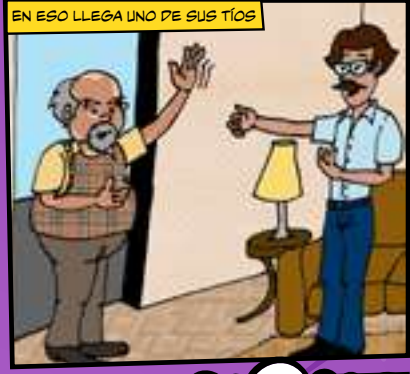
EN ESO LLEGA UNO DE SUS TÍOS