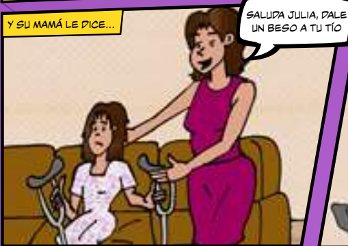
Y SU MAMÁ LE DICE...