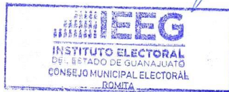
Secretario del Consejo